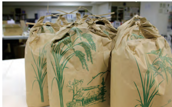
▲12月は、年末年始用の支援に備えて普段以上にたくさんのお米や食料が事務所に並びました。

これらの活動は全て、皆さまからのご支援があってはじめて実施することができました。日頃からの温かいご支援に心より感謝いたします。